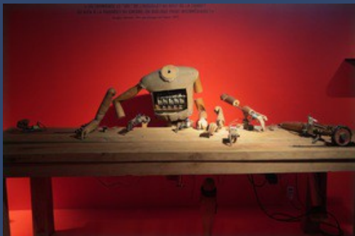
De Doctorandus Stan Wannet, Pays Bas

Nombreux sont les objets qui ont un statut plus proche de celui d'une personne ou d'une créature que d'un simple objet. Ce transfert ou cette confusion qui s'opère alors entre l'humain et le non-humain, et la relation particulière et personnalisée qui les lie, dans les cultures les plus variées est le vaste sujet de cette exposition.