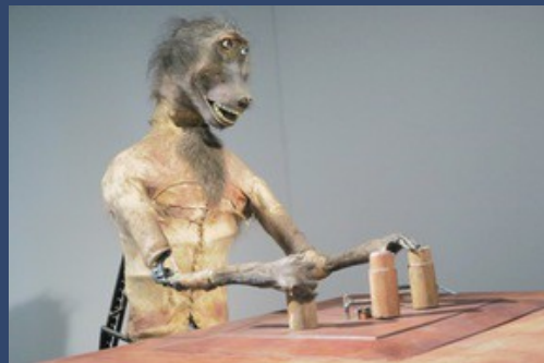
Stan Wannet Civilised Aspirations in Art Monkeys and small time entrepreneurs.